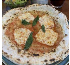
ヘルシーなアサイーパウエル マルゲリータピザ