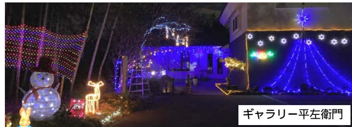
ギャラリー平左衛門