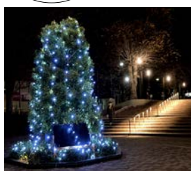
ふれあい橋わたってすぐの理科大学の広場

利根運河交流館や駅、飲食店など周辺の12施設でクリスマスツリーやイルミネーションが楽しめます。サンタなどのオブジェが点灯する「ギャラリー平左衛門」、3階からツリー型にライトをおろす「イニサジャ」、理科大の広場などふれあい橋周辺がメインです。各施設により点灯時間が異なります