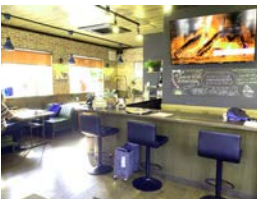
大型モニターでスポーツ観戦も楽しめる