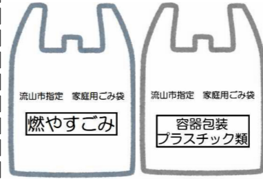
10月からの導入が検討されている指定ごみ袋のイメージ

流山市では、今年10月から「燃やすごみ」と「容器包装プラスチック類」の2種類の指定ごみ袋を導入することを検討しています。昨年9月に市民から意見を募集するパブリックコメントを実施。1月31日(日)13時30分から北部公民館で説明会が行われます。無料。