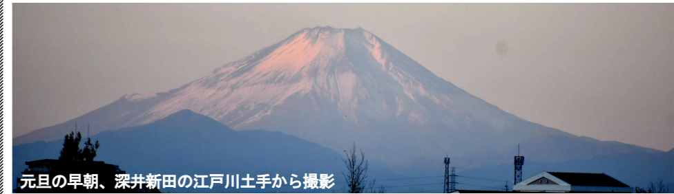
元旦の早朝、深井新田の江戸川土手から撮影

冬晴れの日、利根運河や江戸川の土手では、雪を被った雄大な富士山の姿が望め、東京スカイツリーや筑波山もくっきりと姿を現します。静かな川面もまた、鏡面のように周囲の木々や青空、夕焼けを映し出し、青やオレンジ、ピンク色に染め上げられた幻想的な雰囲気です。日の出の頃の富士山は朝日に照らされ、ほんのりピンク色に染まり、日暮れ時には、裾野に日が沈む様が今しばらくは楽しめそう。日が沈んだ後は、富士山のシルエットが一層濃くなり、空はオレンジ色から紺色のグラデーションに。