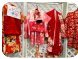
撮影用着物は5~6種類

商店街鶴木精肉店隣りにある「あ・そ・び・ば」に7段飾りのおひな様を展示中。子ども用の着物を着て撮影や工作も楽しめます。10時30分~16時30分頃、3月3日(金)頃まで、無料。