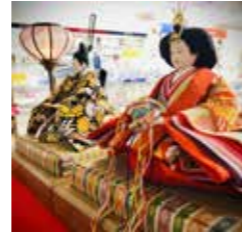
フィットクロス三思堂

写真の2店舗でひな飾りを展示中。Take2でも2月20日(月)頃から展示予定です。