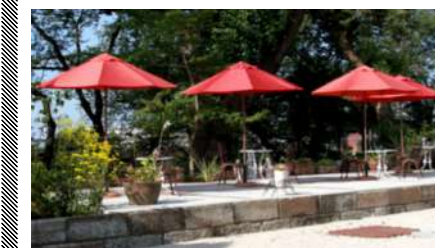
桜の木横の見晴らし台「さくらテラス」