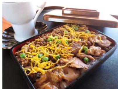
贅沢に重箱にいただく「鶏の照り焼き重」

選。「鶏の照り焼き重(写真右)」は、そぼろを味噌仕立てに、銘柄鶏を鰻のタレで香ばしく焼き上げ、鰻割烹「新川」の職人技が光ります。