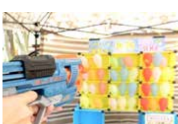
子どもも楽しいバルーン割り射的

5月27日(金)は、お酒の提供もあり、大人の雰囲気。商店街には居酒屋も多く、お店の店頭でお酒やおつまみなどが販売されます。