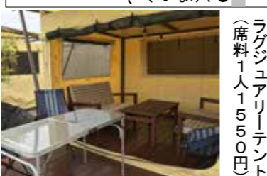
ラグジュアリーテント(席料1人1550円)