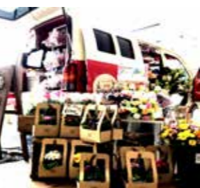
「Lily」は、おしゃれな移動販売車で