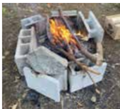
今流行の焚き火体験も

土日祝日 ①10:00~13:00 ②13:30~16:30 ※夏休みや団体は平日も利用可