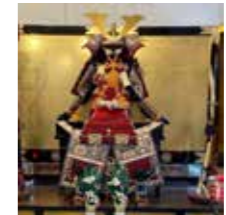
満州屋店内の鑑覧

5/16(月)~29日(日)、商店街の通りを終日車両(自転車も含む)通行止めにして、毎日様々な取り組みが行われます。 問まちづくり推進課 ☎7150-6090