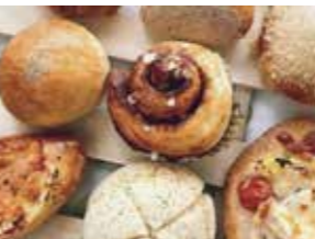
江戸川台西のパン屋「macaroni」も販売