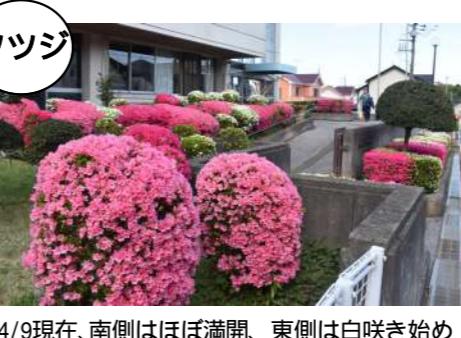
4/9現在、南側はほぼ満開、東側は白咲き始め

東深井福祉会館 2カ所のスロープ周りを中心に、会館の東側から西側まで、少しずつ時期をずらしながら白とピンク色のツツジが咲き誇ります。季節の寄せ植えも楽しめます。