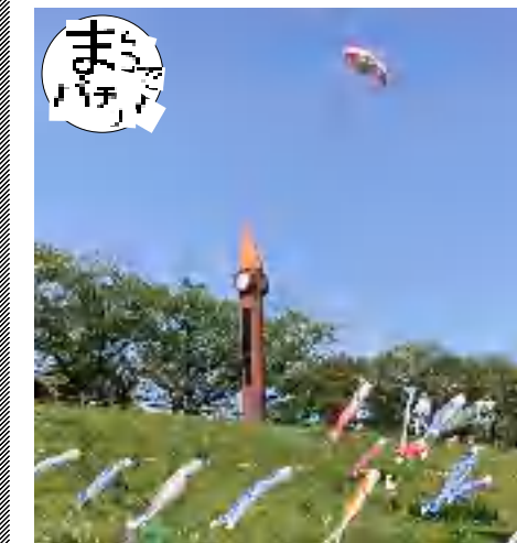
4月下旬と5月上旬に関東上空を飛行した飛行船。利根運河では、こいのぼりとの共演が楽しめました

5月21日(土)10時~15時、公園センターとその周辺でスプリングフェスタが行われます。30区画のフリマも復活、キッチンカーも出店予定です。また木の実工作や、「抹茶を点ててみよう」(600円、当日受付)などのワークショップも充実。@かしわによるリズム遊びの体験会では、みんなで自由に打楽器を叩きながら音楽を奏でます(10時~13時、無料)。