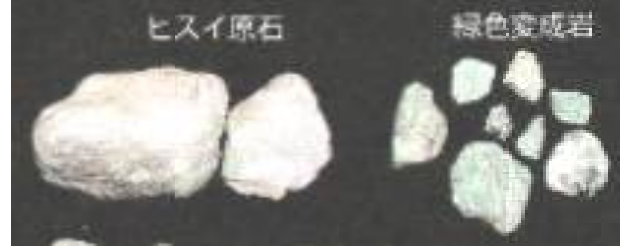
三輪野山貝塚のヒスイ原石と緑色変成岩(右側)

ヒスイ原石 加工作る道具類が発見されたこと、これらことから、ヒスイの玉造ムラとして貴重な存在です。ヒスイの原産地は新潟県糸魚川市の姫川周辺です。糸魚川と交易があったのでしようか。そのルートは山越えなのではないでしょうか。青森県でもヒスイが出土しています。青森県では糸魚川と日本海ルートでの交易があったとされています。その延長として青森経由で海路、太平洋ルートに運ばれたとの見方ができます。ヒスイは遮光器土偶とともに、北東北との交流の可能性に迫る謎とロマンです。