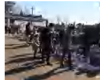
前回フェスタの様子

柏の葉公園で3年ぶりに開催スプリングフェスタ まで楽しめます。雨天一部中止。詳細はホームページで。現在バラ園も開園中、土日祝はスワンポイントも営業中です。 閩 事務所 71342015