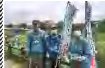
みなさんのお越しをお待ちしています

待機ガイド 利根運河 日曜、10時~15時 新選組陣屋跡(本町) 土・日・祝日、10時~15時 どちらも荒天時は中止、申込不要、無料、春は6月末まで開催。 閩 HPのお問合せ欄から(同会で検索)