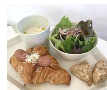
クロワッサンサンドのランチプレート1200円

まるまつ商店×もーいっこ×Koumaが店内でマルシェを初開催。ハンドメイド雑貨やお菓子、ハンドドリッブコーヒーなど約10店舗が販売します。11時～16時。