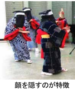
顔を隠すのが特徴

振りつたり、狐やひよつこ などが登場する神楽も披 露され、新春気分が味わ えます。また、流山西馬 音内(にしものない)会が、 日本三大盆踊りの一つで、 秋田県羽後町に約700 年前から踊り継がれてい る西馬音盆踊りを披露し ます。100人、無料、申 込不要、問同館☎715 3-0567