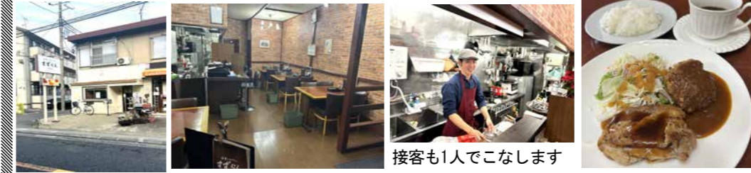
接客も1人でこなします