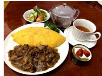
ブイヨンで炊いたチキンライス を卵で包んだオムライス

すべてシェフの手作りで、 デザートからドレッシン グまで手掛けます。 「オススメはハヤシライ スです。気軽に食べに來 られる街のファミレスに なりたい」と、豊富なメ ニューを提供します。 ランチタイムは日替わ りもあり、本日のメイン にサラダと飲み物がつい て950円(写真下)。フルコー