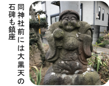
同神社前には大黒天の石碑も鎮座

「浅間様」と呼ばれる西深井小学校近くの浅間神社。創建は不詳で社殿はありません。山頂までは石段があり、石段横にある四合目、五合目という標石で、登山気分を味わえます。頂上では浅間大