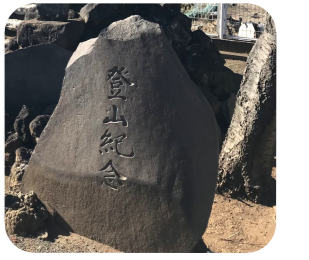
登山記念碑前で写真撮影もおすすめです

運河駅近く、流山街道に隣接する駒形神社。応永6年(1399)9月29日創建、ご祭神は誉田別命です。社殿の左奥に富士塚があります。同神社の富士塚は石段が整備され、7段ある石段を登ると頂上に到達。足元に自信がない人も容易に登ることが出来ます。頂上に浅間大神の石碑が鎮座し、富士塚の周辺には浅間神社の祭神・木花開耶姫の父である大山津見命の石碑や登山記念碑もあります。☎東深井313