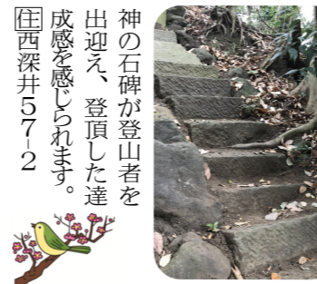
石段は途中崩れてヒヤっとする所もあるので注意