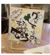
記念日の予約で直筆のカードを進呈