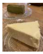
日替わりデザート500円