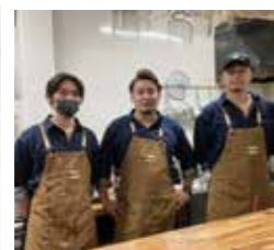
イケメン揃いのスタッフ