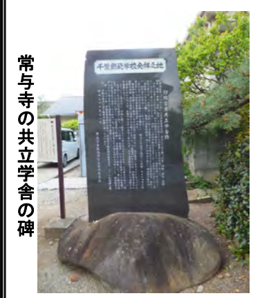
常与寺の立学舎の碑