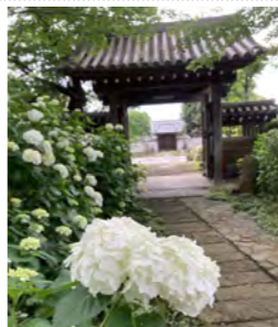
参道を彩る紫陽花

東深井中近くにある浄信寺は、境内に如意輪観音や馬頭観音などの石仏が並び、本堂前には寺の歴史が書かれた石碑もあり、歴史も学べるお寺。四季折々の草木も楽しめる。6月には紫陽花が咲き誇ります。