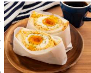
ブランド卵をたっぷり使用した玉子サンド480円(税別)

昨年10月、おたかの森にオープンした「RemoCafe」。開放的なカフェスペースに加え、1人用個室もあり、読書や仕事、勉強など、ひとりの時間を過ごしたい時に最適なカフェです。また、4人まで使用できる会議室もあり、打ち合わせにも便利です。スマホやタブレット端末にアプリをダウンロードして会員登録。