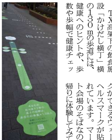
大股2歩を測って転倒リスクをチェック