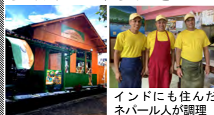
インドにも住んだネパール人が調理

住流山市青田22-3 ☎7157-0903 営モーニング 7:30~10:00 ランチ 11:00~15:00 ディナー 17:00~22:00 休なし、P約30台