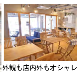
外観も店内外もオシャレ