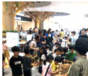
前回のイベントの様子

GLPアルファリンク流山8棟と5棟(ハートケア横)でスプリングフェスタが開催。どちらも入居企業のセールスやサンプル配布、キッチンカー、地域団体や学校の展示や販売が楽しめます。5棟は、フオークリフトの乗車や描いた魚が泳ぐなどの体験も楽しめます。