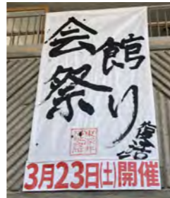
力強い垂れ幕はスタッフの手作り

利用者の発表の場となる「会館祭り」が4年ぶりに復活。えか野菜や、焼き菓子、手作り品などが販売され、コーヒーマ味わえます。絵手紙やパッチワーク作品も展示。子どもコーナーでは3種類のゲームに挑戦してお菓子がもらえます。また、2階のステージには7組が出演。三線や二胡の演奏、フラダンスなどを楽しめます。