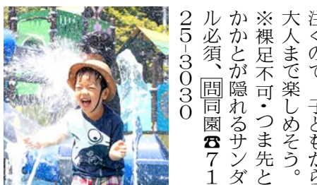
水が貯まるとバケツがひっくり返り、滝のように頭上から水が降り注ぐので、子どもから大人まで楽しめます。