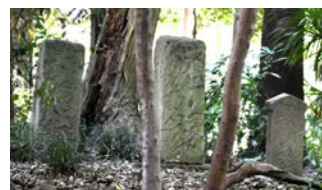
野久木散策の森。流山市に15か所ある市民の森のひとつでしたが、昨年から公園として開放。3月には歩道を整備し、歩きやすくなりました。

「ここは落葉樹を中心、広葉樹が広がる森です。その霧気から隣接する道路は軽井沢通りと呼ばれます。夏も周囲より気温が低いので涼を感じてもらえれば」