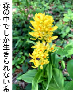
森の中でしか生きられない希少なキンラン

可憐な黄色の花を咲かせるキンラン。一時は盗掘などにより激減しましたが、保護活動が実り、今年も、利根運河の生態系を守る会の案内で2か所での鑑賞会が行われます。 4月25日(土)は、「利根運河・古墳の森 春の観察会(同会主催)」。利根運河沿いを歩きながら、