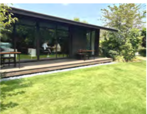
テラス席わんちゃん同伴OK

運河水辺公園から徒歩12分の「クールブリーズカフェ」。1周年を記念して11時〜16時30分にマルシェを開催します。カフェは当日特別メニューで、無農薬の野菜やインド雑貨、耳つぼジュエリーの販売、行政書士によるペットと私の相談コーナーなど。