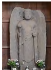
犬塚の耳垂れ地蔵

われています。以上のように地蔵は死後の世界を救う仏として信仰されましたが、江戸時代になると現世も救う仏として信仰されました。具体的な利益として例を挙げると、巢鴨のとげぬき地蔵、思井の耳垂れ地蔵(写真左下)、各地にある延命地蔵、子宝地蔵、身代わり地蔵、出世地蔵などがあります。旅の安全を守る地蔵は道標も兼ねて