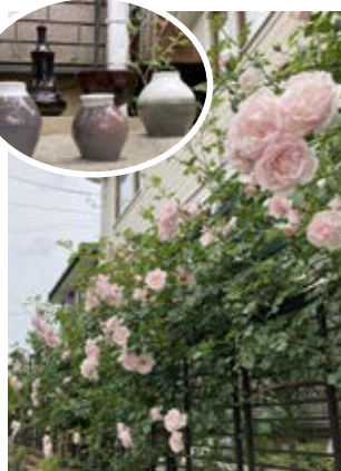
バラとアート作品がコラボ(昨年の様子)

5/3(金)~6(月)と10(金)~13(月)10時~16時に、英誠寮で「ガーデンギャラリー それぞれの手仕事展」が開催されます。陶器や油彩、染付といった6人の作家の作品をバラが咲く庭園に展示。道路から見学できます(庭には入れません)。 〒江戸川台西4-177-3