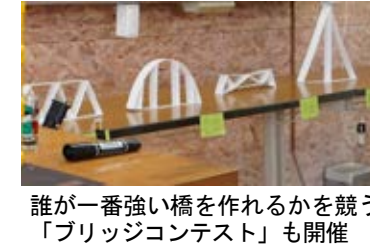
誰が一番強い橋を作れるかを競う「ブリッジコンテスト」も開催