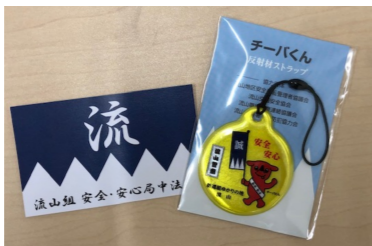
隊士カードとチーバクんの反射材

流山警察署や移動交番、及び啓発イベントなどで、流山警察署の伊藤博厚署長は「移住者や市民がこの機会に街の良さを知り住んでよかったと思われ安全安心な街にしたいと語りました。隊士カード・反射材はなくなり次第終了です。サービスは令和4年3月31日まで利用可能。協力店の詳細は流山市役所のホームページで随時更新中です。 岡流山警察署 ☎7159-0110