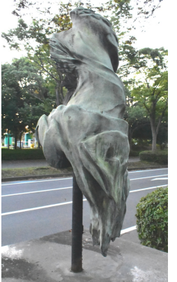
がんセンター近くに立地し、やすらぎや心の癒いを与えることと選定

①~③は外国人の作品 ① ヴィナスの誕生(イタリア人作) ② 平和と人間(ドイツ人作) ③ 太陽(フランス人作)