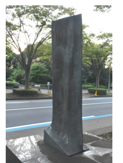
魂が伸びゆく姿や大地に根ざして大空に向かって発展してゆくイメージ