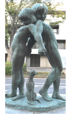
⑦二人と猫 (岩田健作)

愛媛県今治市に専門美術館がある岩田健氏が制作。「充」と同様に、うるおいや愛情、生活の育みや成長のイメージを与えることと選定された