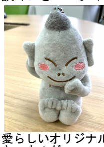
愛らしいオリジナルキーホルダー