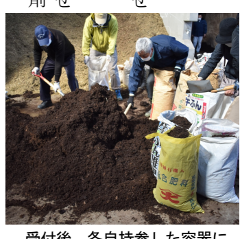
受付後、各自持参した容器に詰めて持ち帰り

「土に混ぜると塊が随分なくなるんです。無料で頂け、助かります」と、自宅の庭で野菜を育てているという男性は歓迎した様子。エコセンターの鈴木さんは、「木は生き物。焼却するより手間はかかりませんが、堆肥として役を立て、木も喜んでくれると思います。剪定枝を持ち込む際は、異物が混入しないようご協力ください」と、話しました。