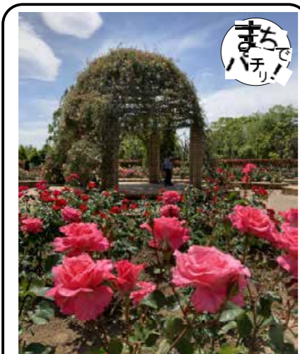
柏の葉公園の春季バラ園開園中 見頃を迎えています

5月27日(土)10時〜15時、陸上競技場周辺でスプリングフェスタが行われます。今回は工作の他、消防車・救急車・白バイ・パトカーなどの車両展示。プロのラケビー選手を相手にトライを決めたり、バスケの305レンジャー相手にフリースローにチャレンジなど、スポーツ体験も楽しめます。メイン通りには唐揚げ、串揚げ、焼きそば、き水などバラエティー豊かなキッチンカーが多数出店します。抹茶一服(500円)、歩行年齢の測定会。み