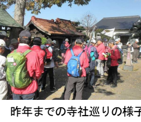
昨年までの寺社巡りの様子

◆秋から少しずつ始めませんか 柏の葉ウォーキングクラブ 今年には特にコロナ禍の自粛生活による運動不足解消と参加者の健康維持を意識し、運動習慣や仲間作りを目標に、感染対策をしながら行います。