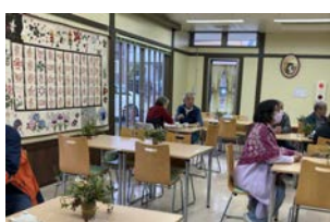
壁には手話の指文字を示した作品も展示

11月26日、森の図書館に隣接する高齢者福祉センター森の倶楽部に、同施設利用者の憩いの場となる「森の手話カフェ」がオープンしました。