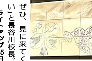
陶板モニュメント。テーマは「回歸する自然」

11月18日、新川小学校で、創立150周年記念イベント「新小発表会」が開催され、地域の人や卒業生、保護者が参観しました。「150の伝統 光輝け新川小」をスローガンに、自分たちの学校や地域の歴史などについて学び、どういうイベントにするか準備してきた児童たち。当日は各学年に分かれ、地域で採れたトングリなどの手作りおもちゃで遊べるコーナーや、市の特産品の小松菜やほうれん草などを使った料理の試食会、北部地域の魅力についての討論会などが行われました。4年生の発表の「流山音頭」は、参観に来ていた人も踊りに参加し、卒業生からは「子ども時代に踊った懐かしい」という声も。「記念事業として、ライトアップや陶板モニュメントの作成も行われました。地域や卒業生に温かく見守られているというところを見ても感じたいと思います。も見られます。