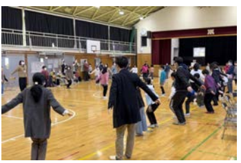
みんなで盛り上がる流山音頭

11月18日、新川小学校で、創立150周年記念イベント「新小発表会」が開催され、地域の人や卒業生、保護者が参観しました。「150の伝統 光輝け新川小」をスローガンに、自分たちの学校や地域の歴史などについて学び、どういうイベントにするか準備してきた児童たち。当日は各学年に分かれ、地域で採れたトングリなどの手作りおもちゃで遊べるコーナーや、市の特産品の小松菜やほうれん草などを使った料理の試食会、北部地域の魅力についての討論会などが行われました。4年生の発表の「流山音頭」は、参観に来ていた人も踊りに参加し、卒業生からは「子ども時代に踊った懐かしい」という声も。「記念事業として、ライトアップや陶板モニュメントの作成も行われました。地域や卒業生に温かく見守られているというところを見ても感じたいと思います。も見られます。