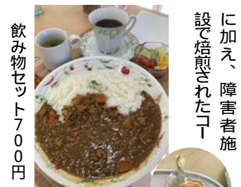
さつき園のクッキー100円

12月のオープン 20日(水)・24日(日) 11時から16時、注文はランチ14時・喫茶15時30分まで。 問 森の倶楽部 7152-2373