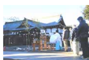
例年の駒形神社の様子